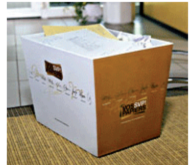
Papiersammelkorb des Kantons Genf

Dieses von der Eidgenossenschaft unterstützte Projekt hat zum Ziel, ein System einzuführen, das Qualitätsführung, Sicherheit- und Umweltmanagement innerhalb der Kantonsverwaltung ermöglicht.